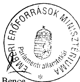
Rétvári Bence államtitkár