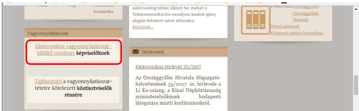
3. ábra Az „Elektronikus vagyonnyilatkozat-kitöltő rendszer képviselőknek” elérése