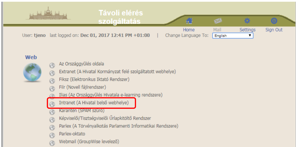
2. ábra RSA kapcsolattal elérhető szolgáltatások