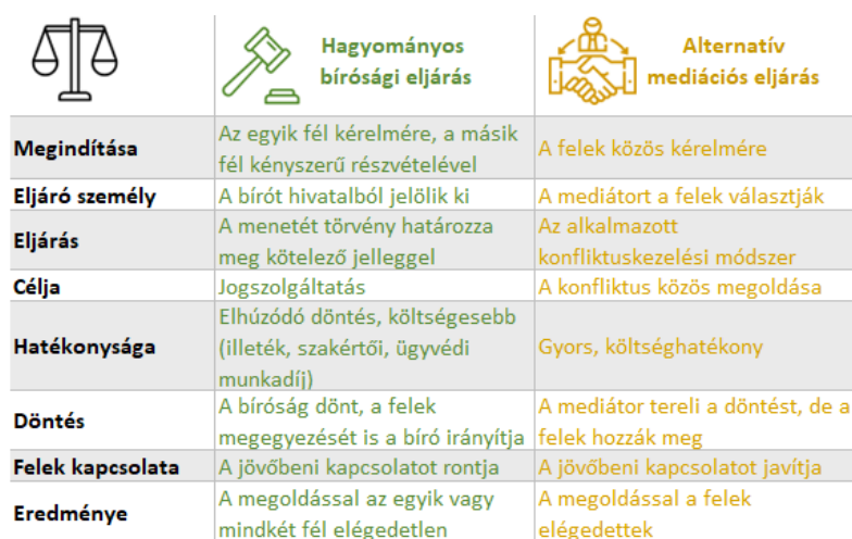
1. ábra: A hagyományos bírósági és az alternatív mediációs eljárások jellemzői