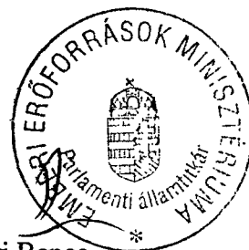
Rétvári Bence államtitkár